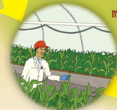
mbegu ya mzalishaji