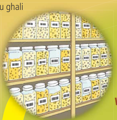
benki ya vinasaba